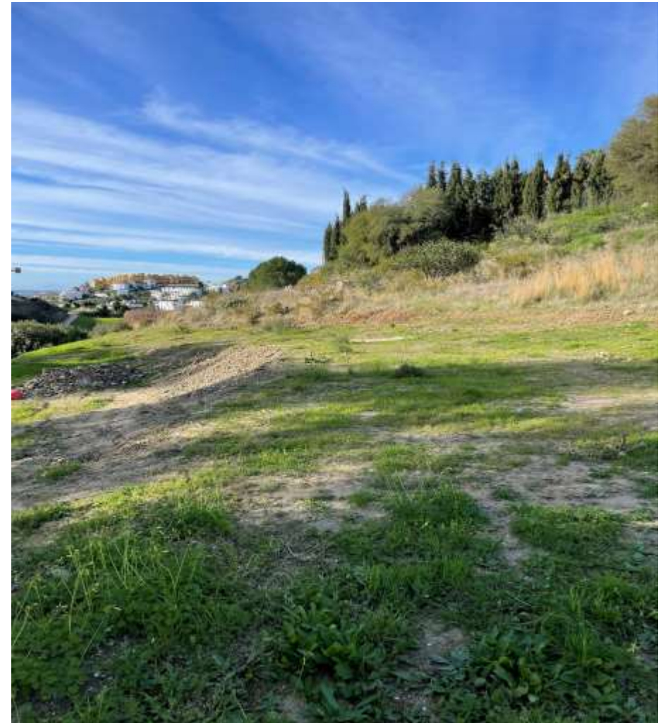
Photos of the property